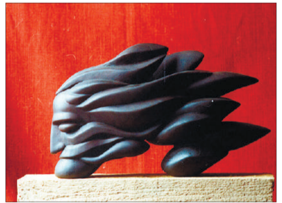
Скульптура «Ветер», которая должна была стать памятником

- Мне недавно прислали фотографии того времени, когда я ее дарил музею. Я там молодой. Действительно, ты себя не оцениваешь хорошо в настоящем времени, только спустя годы понимаешь: самое лучшее сейчас!