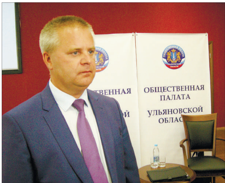
Александр Чепухин - новый председатель региональной Общественной палаты