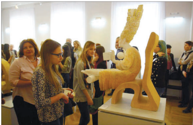
Работы Дмитрия органичны в музее