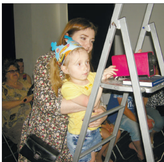
Во время показов участники могли сами крутить ручку проектора и пробовать себя на «озвучке»

Если вы когда-то занавешивали окна плотными покрывалами и с упоением часами просиживали, уставившись на белую стену или дверь, то, скорее всего, у вас в детстве был проектор для диафильмов. И процентов на 80 - вы родом из эпохи СССР.