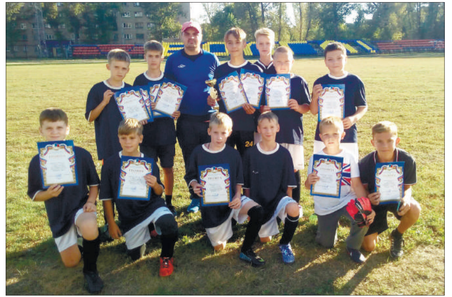
Благодаря постоянным тренировкам с дворовым инструктором команда ТОС «Ульяновский, 2» не раз становилась призером различных соревнований городского и районного масштаба среди ТОСов

Управление по физической культуре и спорту администрации города выразило благодарность дворовым тренерам за добросовестную работу.